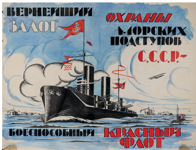
Неизвестный художник. Плакат. 1920-1930-е гг.

После окончания Гражданской войны положение Рабоче-Крестьянского Красного Флота было крайне тяжелым. За семь военных лет он израсходовал все свои боевые и материально-технические запасы, потерял значительную часть кораблей и баз. Война и разруха тяжело отразились на судостроительной промышленности. Десятки тысяч военных моряков, преданных делу революции, ушли с кораблей на фронт, а затем оказались на партийной, советской и хозяйственной работе. К восстановлению флота страна приступила в марте 1921 г., после X съезда РКП(б). Для организации этого необходимо было донести идеи до масс, зажечь их и повести за собой. Агитационно-пропагандистская работа велась по многим направлениям.