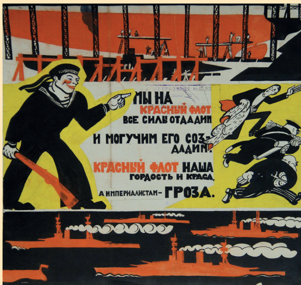
Плакат. Неизвестный художник. 1920–1930-е гг.

На выставке, рассказывающей о становлении советского агитационного искусства на флоте 1920–1930-х гг., впервые представлены 37 плакатных рисунков, посвященных созданию РККФ. Картины, бюсты выдающихся деятелей РККФ, знамена, награды, фотографии, документы, оружие, модели кораблей, газеты, книги и журналы, агитационные предметы передают атмосферу драматического периода 1920–1930-х гг.