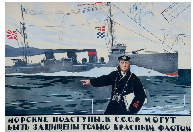
Неизвестный художник. Плакат. 1920-1930-е гг.

агитация, за свою понятность и доступность. Тысячи девочек и мальчишек, детство которых было опалено войной, затаив дыхание, смотрели фильмы о подвигах моряков («Броненосец «Потемкин», «Мы из Кронштадта», «Морской пост», «Четвертый перископ», «Моряки» и др.). Именно это поколение дало Родине замечательных командиров.