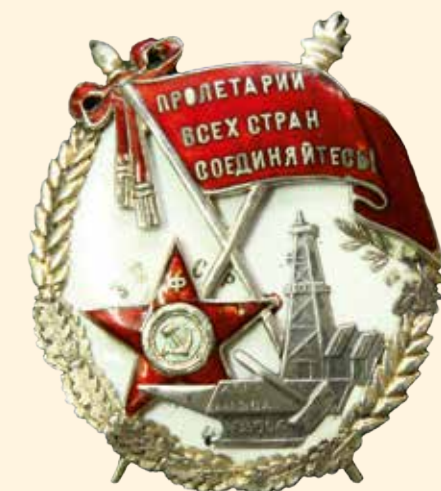
Орден Трудового Красного Знамени Принадлежал крейсера «Красный Кавказ» 1932–1933 гг. Серебро, эмаль, металл. 5,7 x 5 см