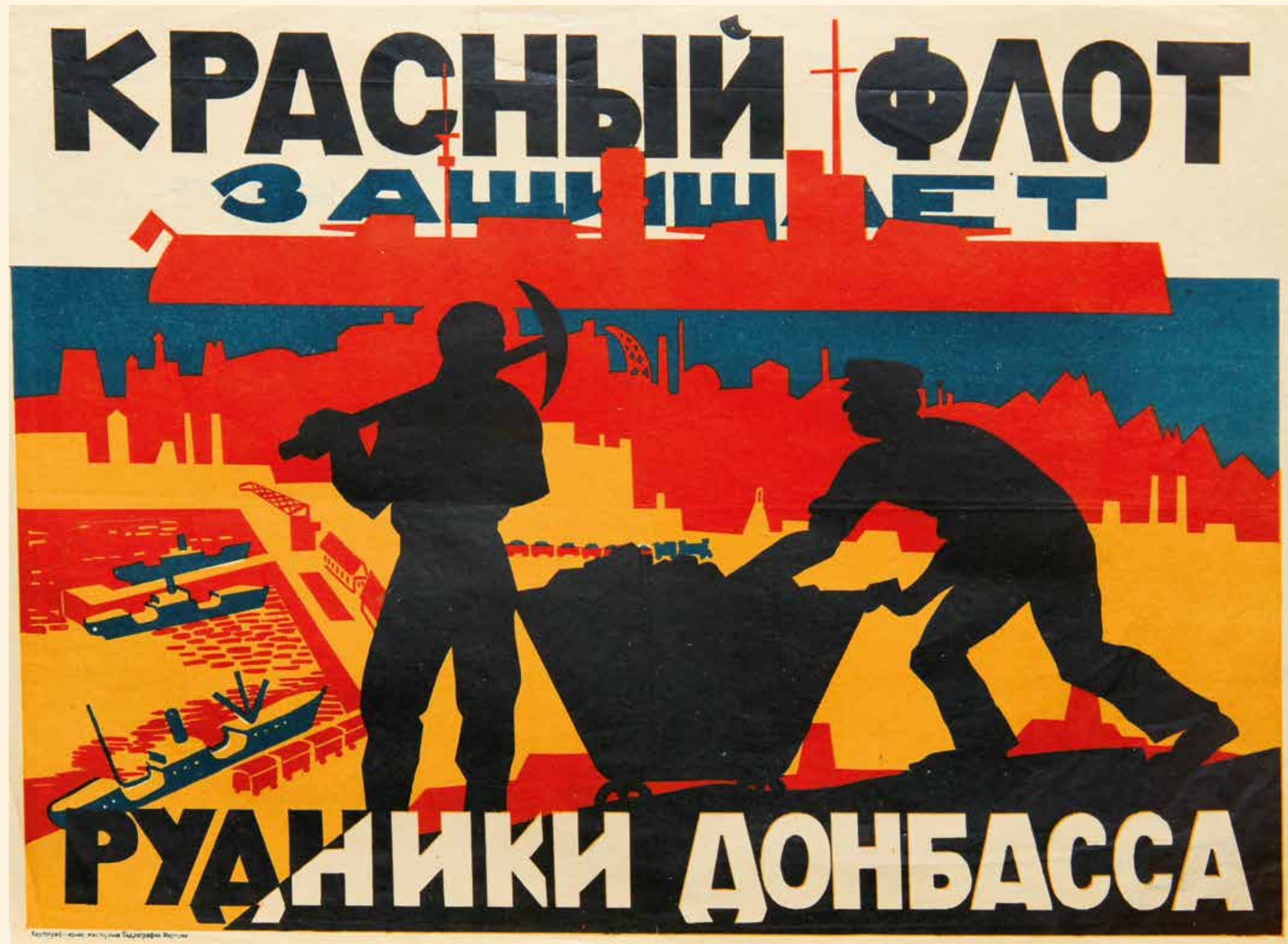
Плакат «Красный флот защищает рудники Донбасса» 1920-е гг. Бумага, печать. 40 x 55 см