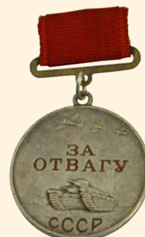
Медаль «За отвагу» 1938–1940 гг. Серебро, металл, эмаль, лента репсовая Диаметр 3,7 см