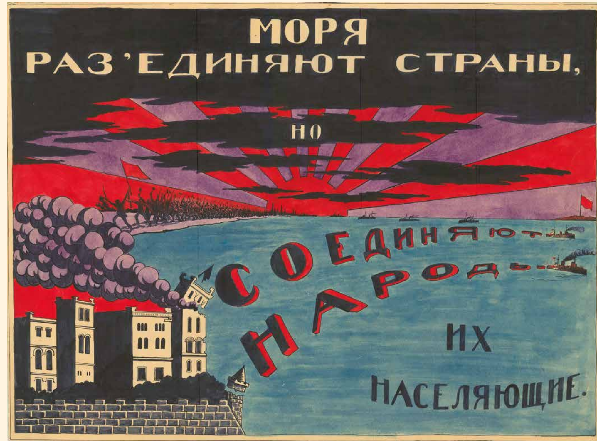
Плакат «Моря разъединяют страны, но соединяют народы, их населяющие» 1920-е гг. Картон, гуашь. 46,5 x 63,5 см