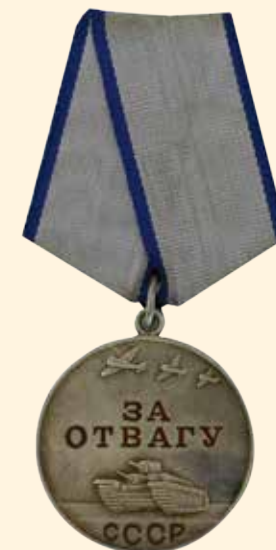
Медаль «За отвагу» 1945 г. Серебро, эмаль, муар, металл. Диаметр 3,7 см