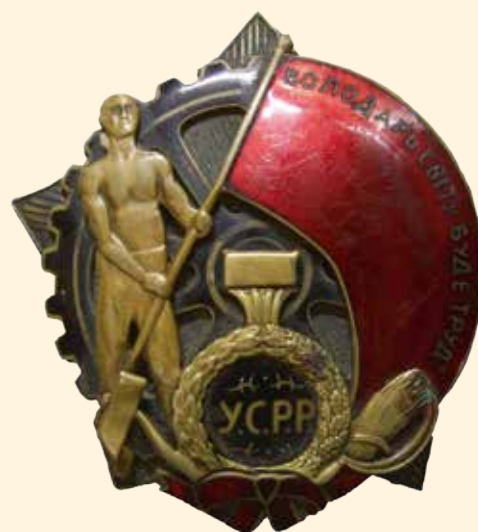
Орден Трудового Красного Знамени УССР 1920-е гг. Бронза, эмаль. 5,8 x 6 см