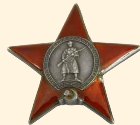
Орден Красной Звезды Принадлежал начальнику штаба КБФ И. С. Исакову 1934 г. Серебро, эмаль, металл. 4,5 x 4,7 см