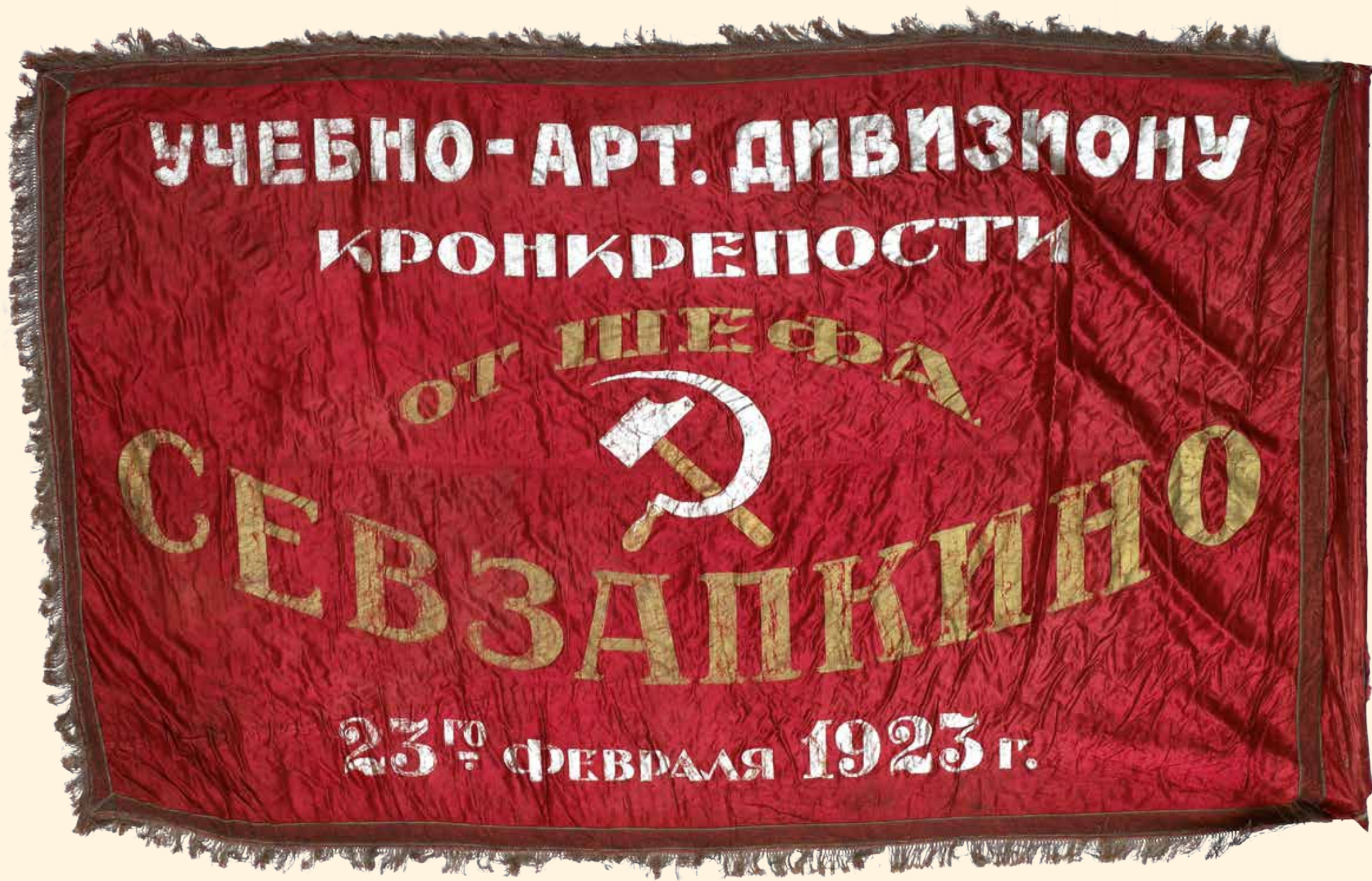
Знамя Подарок Учебно-артиллерийскому дивизиону Кронштадтской крепости от шефа Севзапкино 1923 г. Шелк. 208 x 140 см