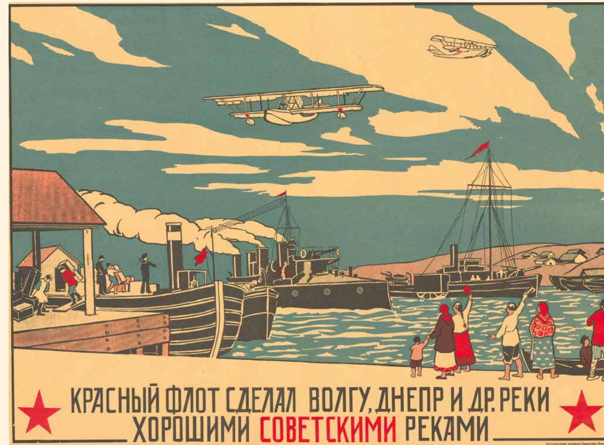
Плакат «Красный флот сделал Волгу, Днепр и другие реки хорошими советскими реками» г. Ленинград 1920-е гг. Бумага, печать. 49 x 67 см