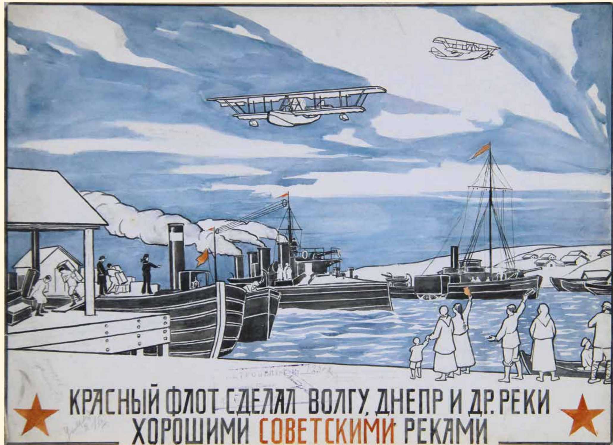
Плакат «Красный флот сделал Волгу, Днепр и другие реки хорошими советскими реками» 1920-е гг. Картон, гуашь. 48 x 67 см