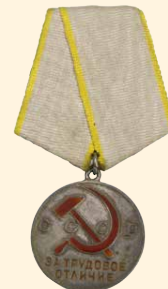
Медаль «За трудовое отличие» Принадлежала директору-полковнику путей сообщения Д. М. Реховскому 1939–1940 гг. Серебро, металл, эмаль, лента муаровая, 8,5 x 4,6 см