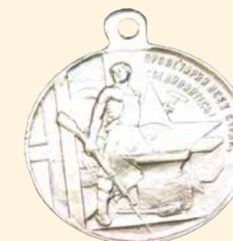
Медаль «В память 3-летия Великой Октябрьской социалистической революции» 1920 г. Серебро. Диаметр 3,5 см