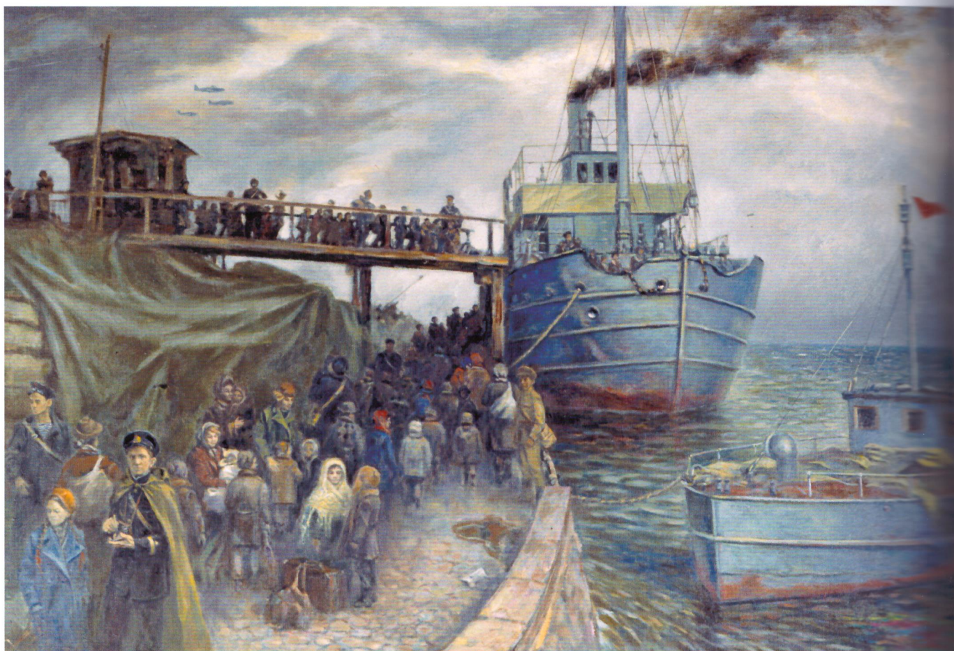
М. А. Кузнецов. Эвакуация детей через Ладогу из блокадного Ленинграда в 1941 году. 1997

Летом 1941 года финская армия развернула наступление на восточном и западном берегу Ладужского озера, быстро продвигалась к югу. Три стрелковые