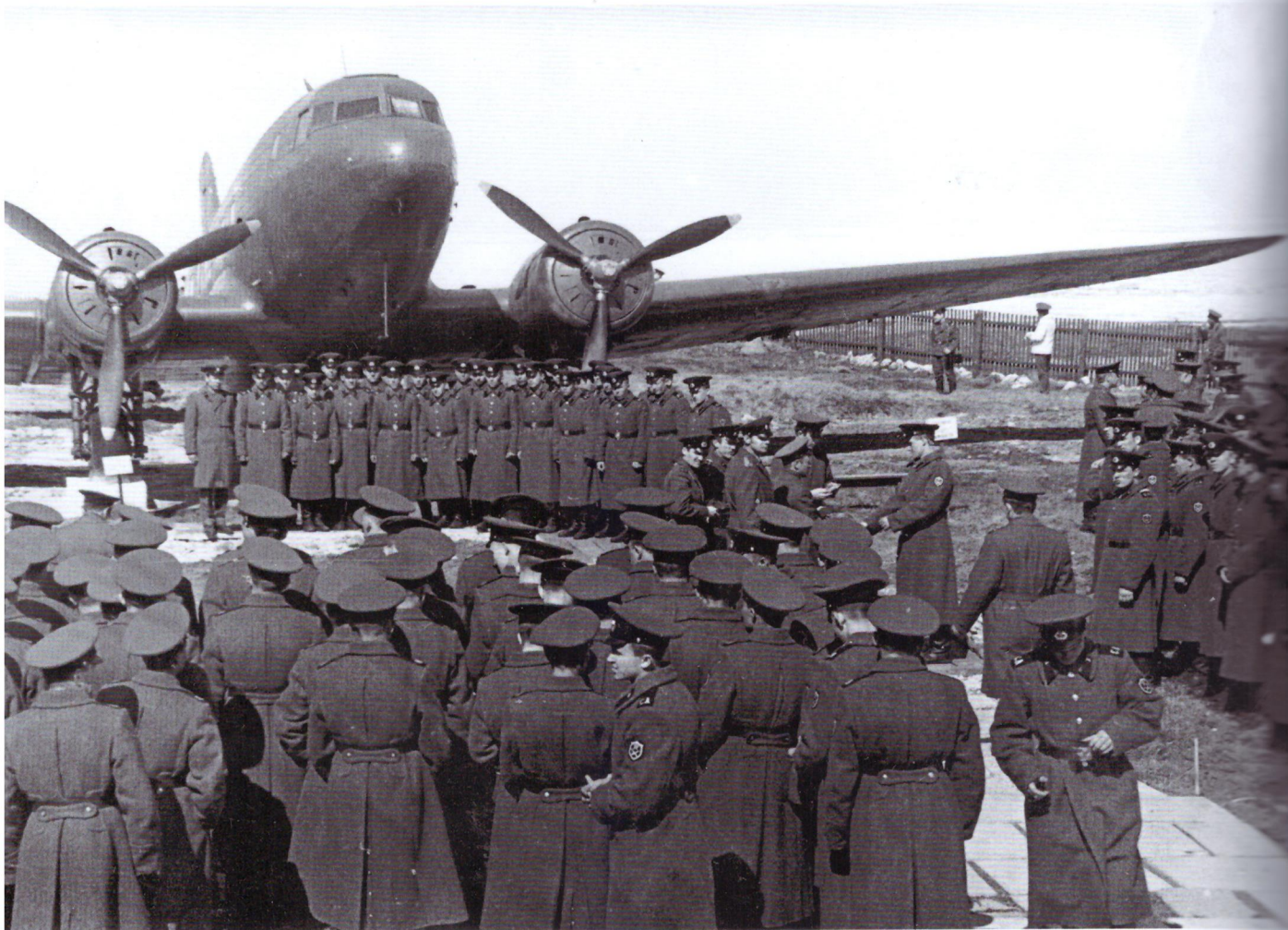
Одно из массовых мероприятий, проводившихся ежегодно в филиале ЦВММ «Дорога жизни» командованием воинских частей (приведение к присяге, вручение погон младшим командирам, празднование исторических дат и т. д.). После 1973-го

К 70-летию Победы в Великой Отечественной войне было принято решение о полной реконструкции территории филиала «Дорога жизни». К открытию реконструированного музейного комплекса