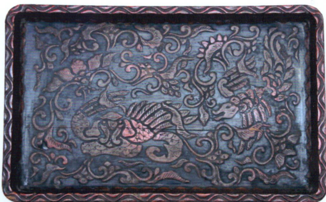
Поднос японской работы, принадлежавший вице-адмиралу З.П. Рожественскому

В витринах находятся личные вещи команды корабля, позволяющие получить представление о быте военных моряков того времени. Особо интересен поднос сервировочный японской работы, принадлежавший адмиралу З.П. Рожественскому, командующему 2-й Тихоокеанской эскадрой.