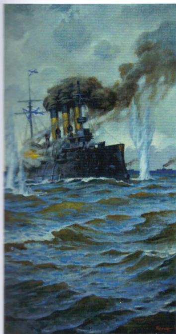
В. Яркин. Крейсер «Аврора» в Цусимском сражении. 1905 год. 2016