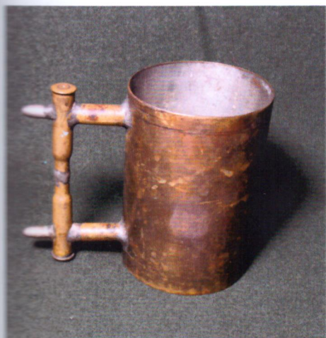
Самодельный стакан из орудийной гильзы 1900-е