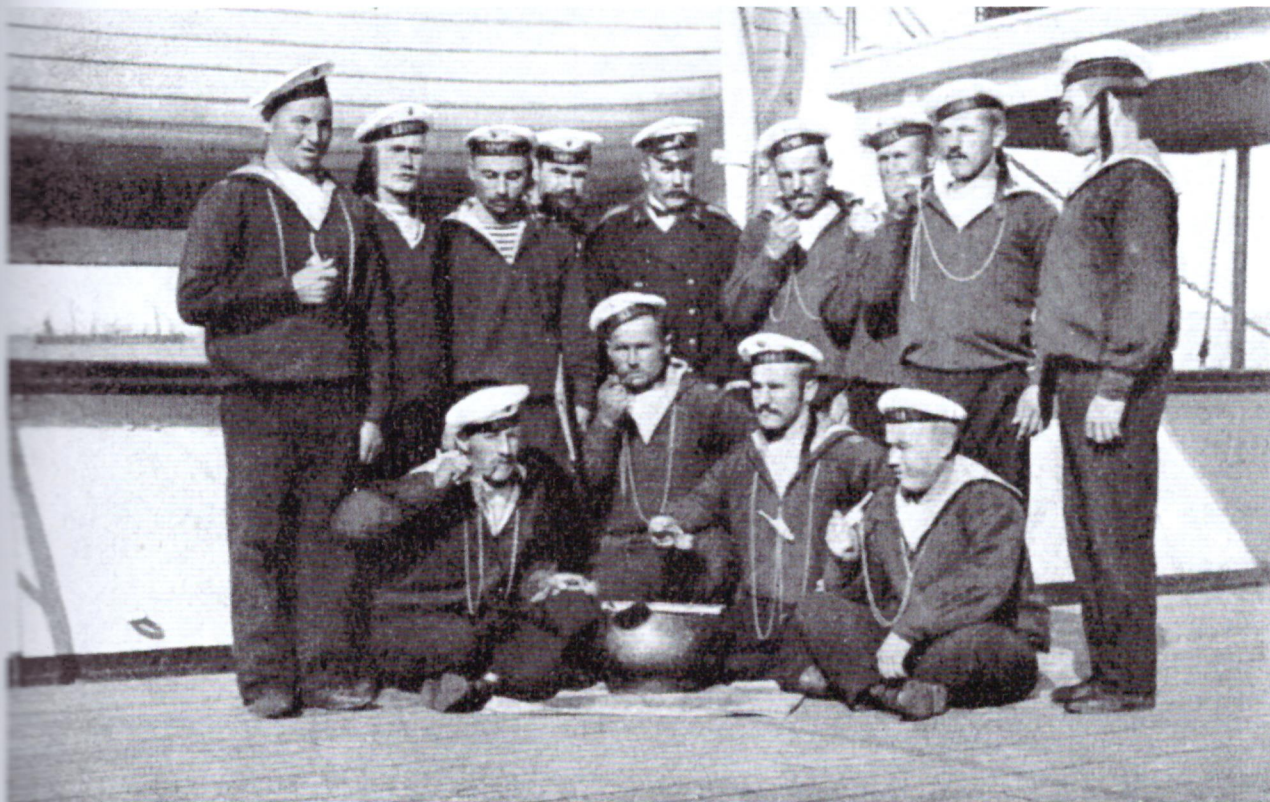
Выдача винной порции. 1900-е

В витринах находятся личные вещи команды корабля, позволяющие получить представление о быте военных моряков того времени. Особо интересен поднос сервировочный японской работы, принадлежавший адмиралу З.П. Рожественскому, командующему 2-й Тихоокеанской эскадрой.