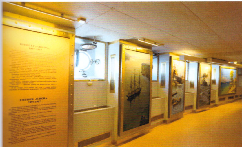
Интерьер зала № 1

На левом и правом бортах представлены живописные полотна, написанные художниками-маринистами Центрального военно-морского музея и отображающие важнейшие этапы боевого пути корабля.