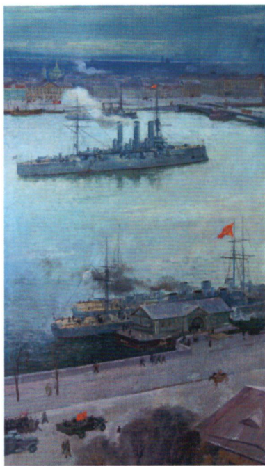
С. Пен. Крейсер «Аврора» на Неве в октябрьские дни в Петрограде. 1917 год. 1986