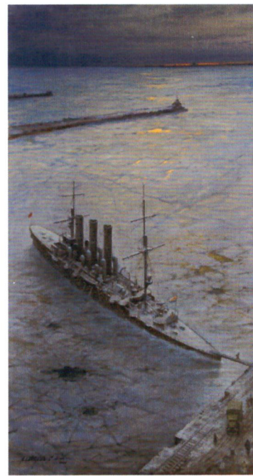
С. Макаров. Крейсер «Аврора» в военном порту Ораниенбаум в 1943 году. 2016