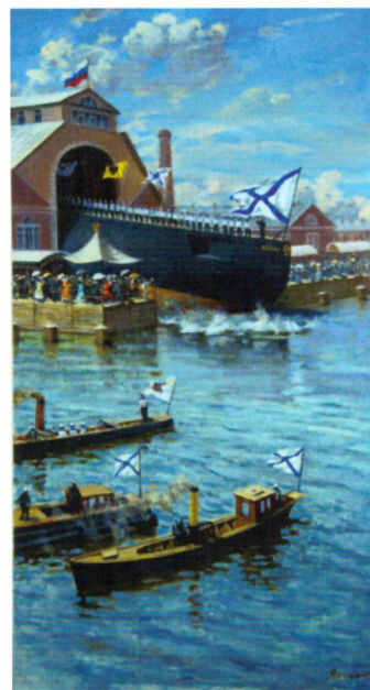
В. Яркин. Спуск на воду крейсера «Аврора» в 1900 году. 2016