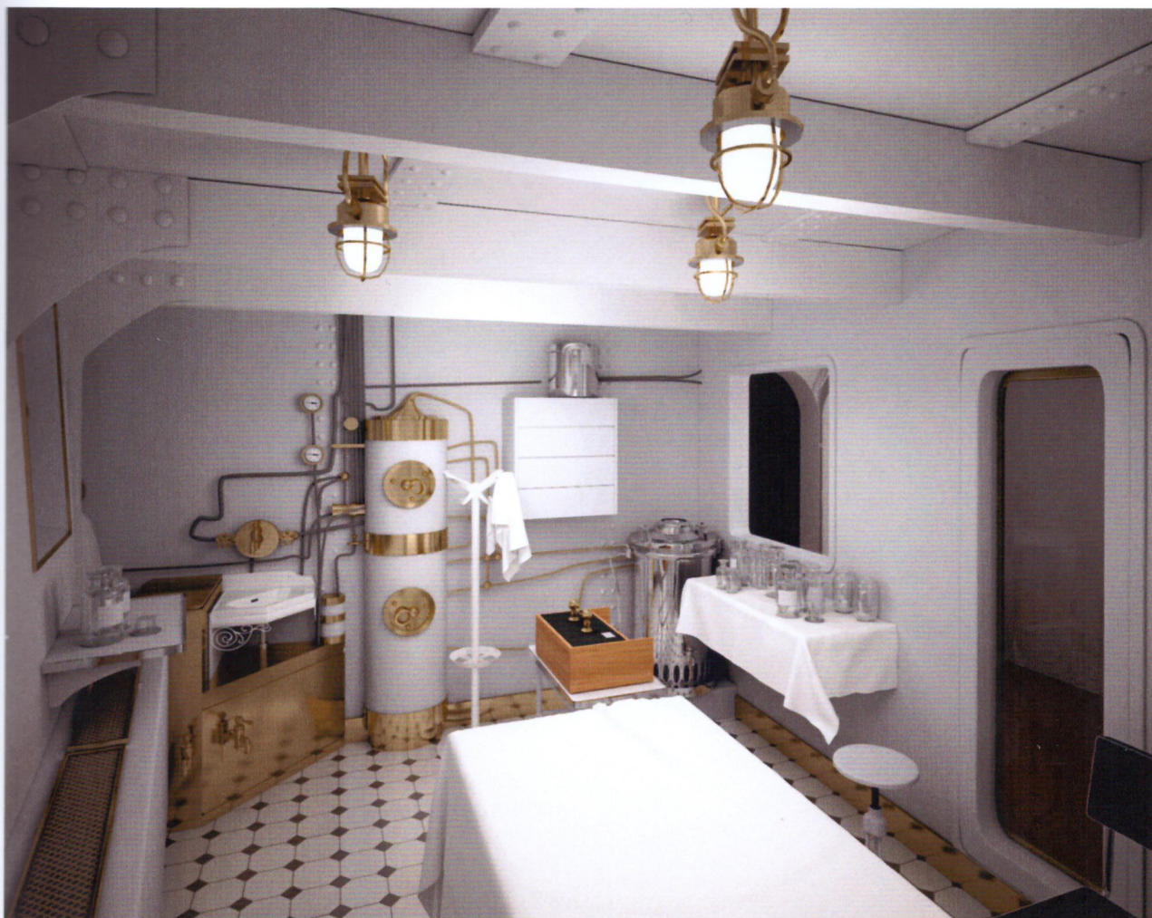
Фрагмент экспозиции операционного зала крейсера «Аврора». 2016

Помещение операционной (амбулатории) оборудовано современными мультимедийными средствами, которые создают у посетителей полную иллюзию присутствия на хирургической операции, проводимой в корабельных условиях.