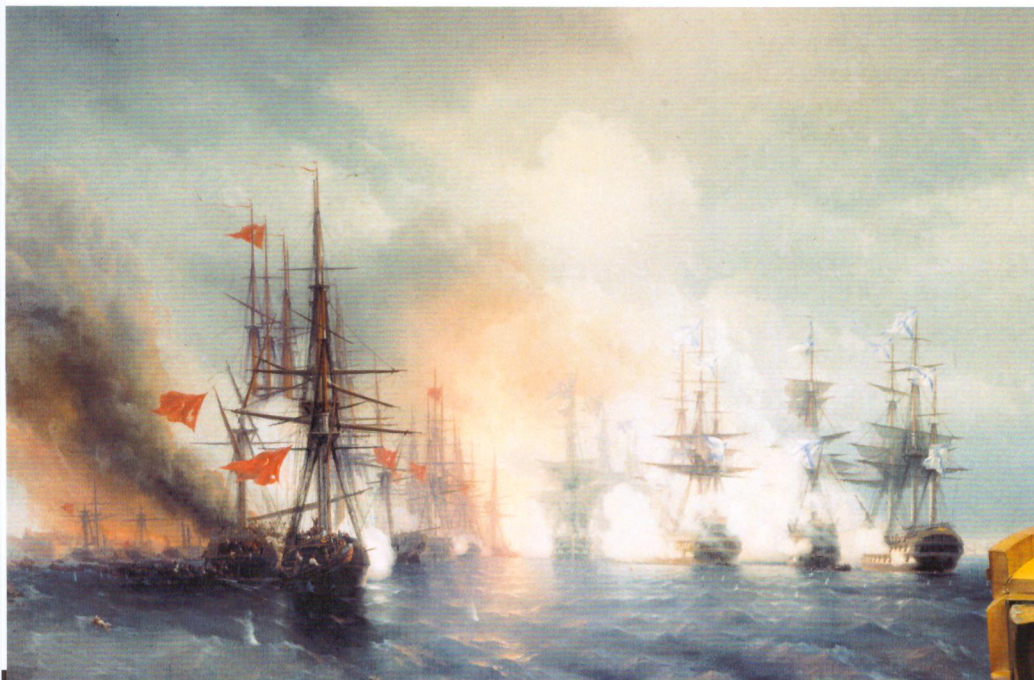
И. К. Айвазовский. Синопский бой 18 ноября 1853 года. 1853

окончилась поражением России. По Парижскому мирному договору Черное море объявлялось нейтральным, Россия имела право держать там лишь несколько военных судов. Война выявила серьезное техническое отставание и тактические просчеты русских вооруженных сил и показала необходимость реформирования армии и флота.