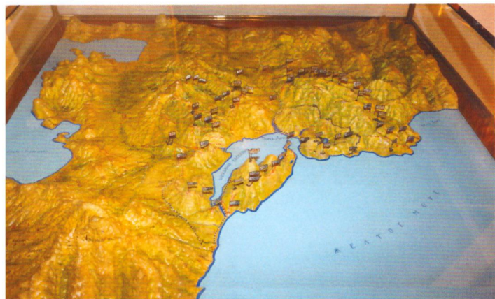
Карта рельефная обороны Порт-Артура в 1904 году. Выполнена одним из участников обороны крепости Порт-Артур

По разным оценкам потери японской армии составили около ста тысяч человек, русский флот и гарнизон приковали к себе почти весь флот неприятеля.