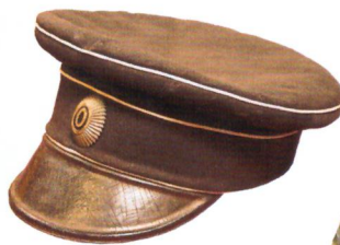
Фуражка вице-адмирала С.О. Макарова. 1904