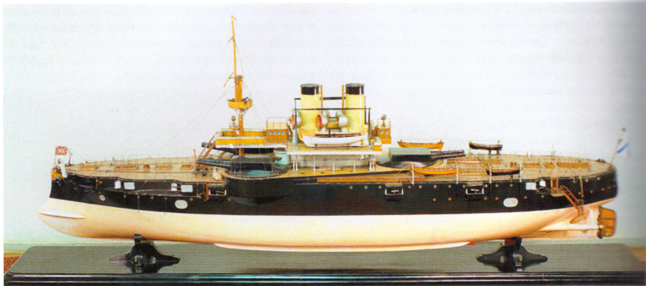
Модель броненосного корабля Черноморского флота «Синоп», 1887

Был вооружен шестью 12-дюймовыми (305-мм) орудиями главного калибра в барбетных установках