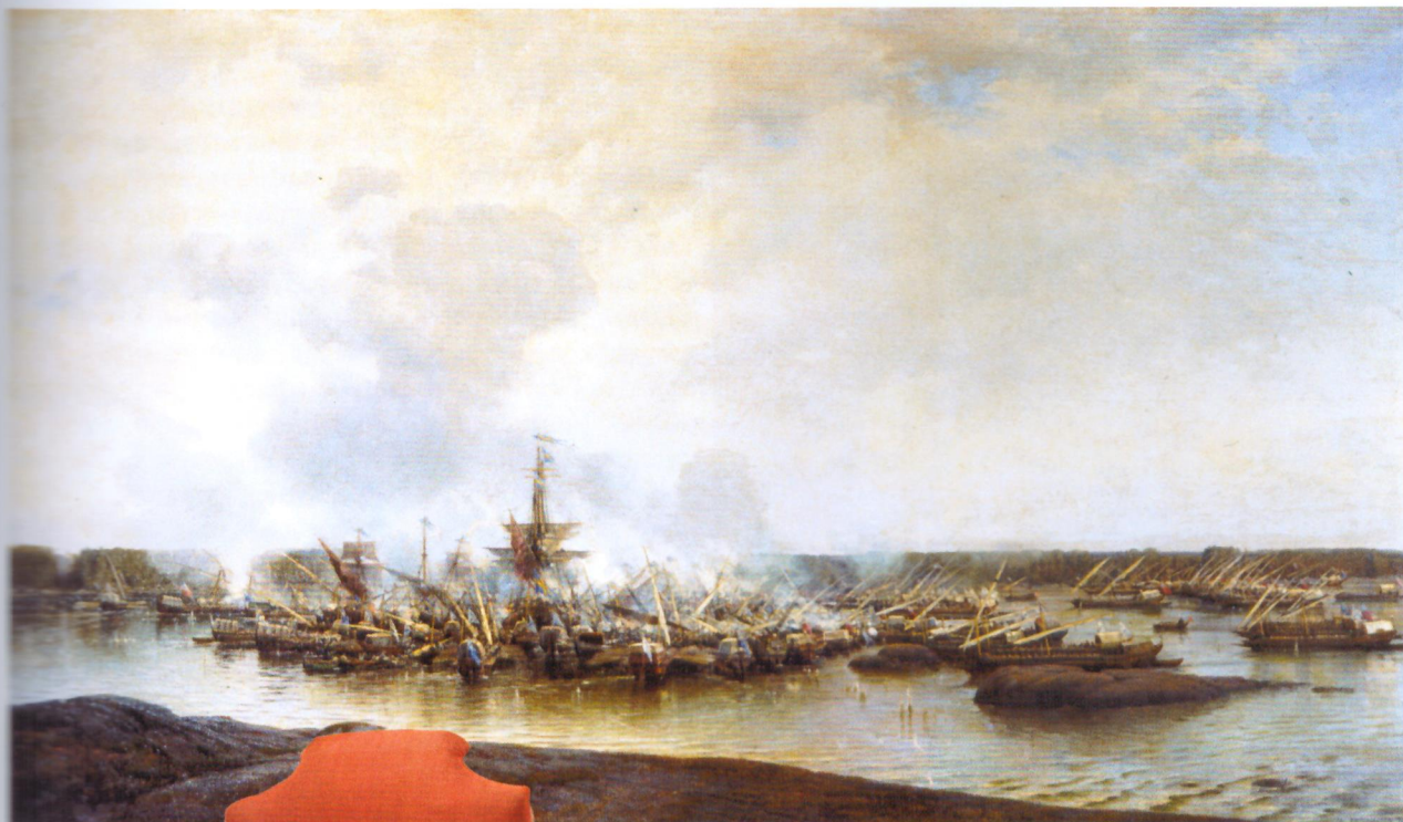
А. П. Боголюбов. Гангутское сражение 27 июля 1714 года. 1875—1877