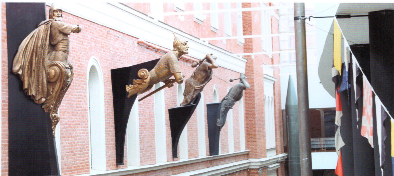
Носовые украшения и модели носовых украшений кораблей. 1860–1870-е