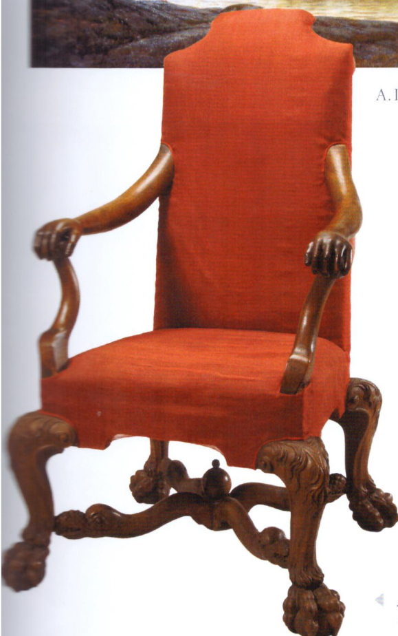
◀ Адмиралтейское кресло императора Петра I