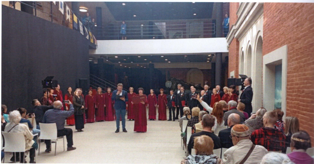
Праздничная тематическая программа, концерты

«Этот День Победы!» — праздничные мероприятия, посвященные Дню Победы