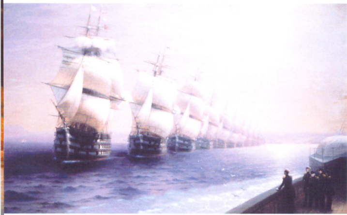
И. К. Айвазовский. Маневры Черноморского флота в 1850 году. 1886