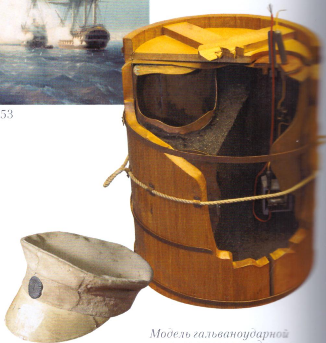
Фуражка адмирала П. С. Нахимова