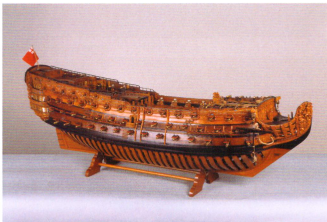
Модель английского 100-пушечного корабля первого ранга «Ройал Соверейн». Подарок Петру I от королевы Англии Анны в начале XVIII в.