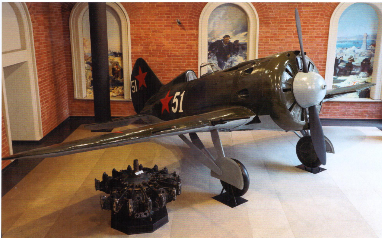
Истребитель И-16 конструкции Н. Н. Поликарпова

Один из самых массовых истребителей 1930-х годов. На данном самолете с июля по октябрь 1941 года воевал в составе 2-го смешанного полка ВВС Северного флота Б. Ф. Сафонов, дважды Герой Советского Союза