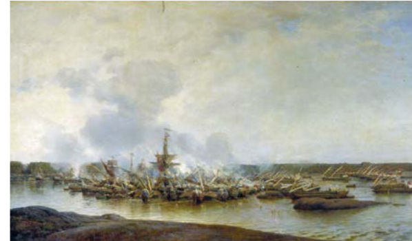
А.П. Боголюбов Гангутское сражение в Финском заливе 27 июля 1714 г. 1875–1877 гг. Холст, масло. 320 x 183 см

Боголюбов в 1850 г. был зачислен в Императорскую Академию художеств в класс «рисовальный с оригиналов», где занимался