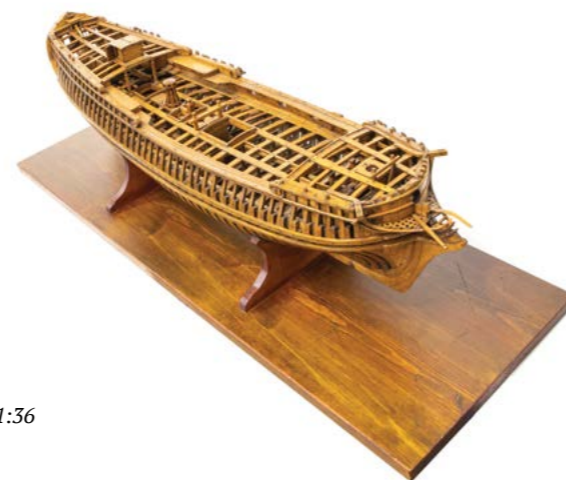
Блез Пангало Модель французского 24-пушечного фрегата «Ла Лежер», 1682 г. Из коллекции А.П. Боголюбова, 1682. Дерево. 26,0 x 102,0 x 27,0 см, масштаб 1:36