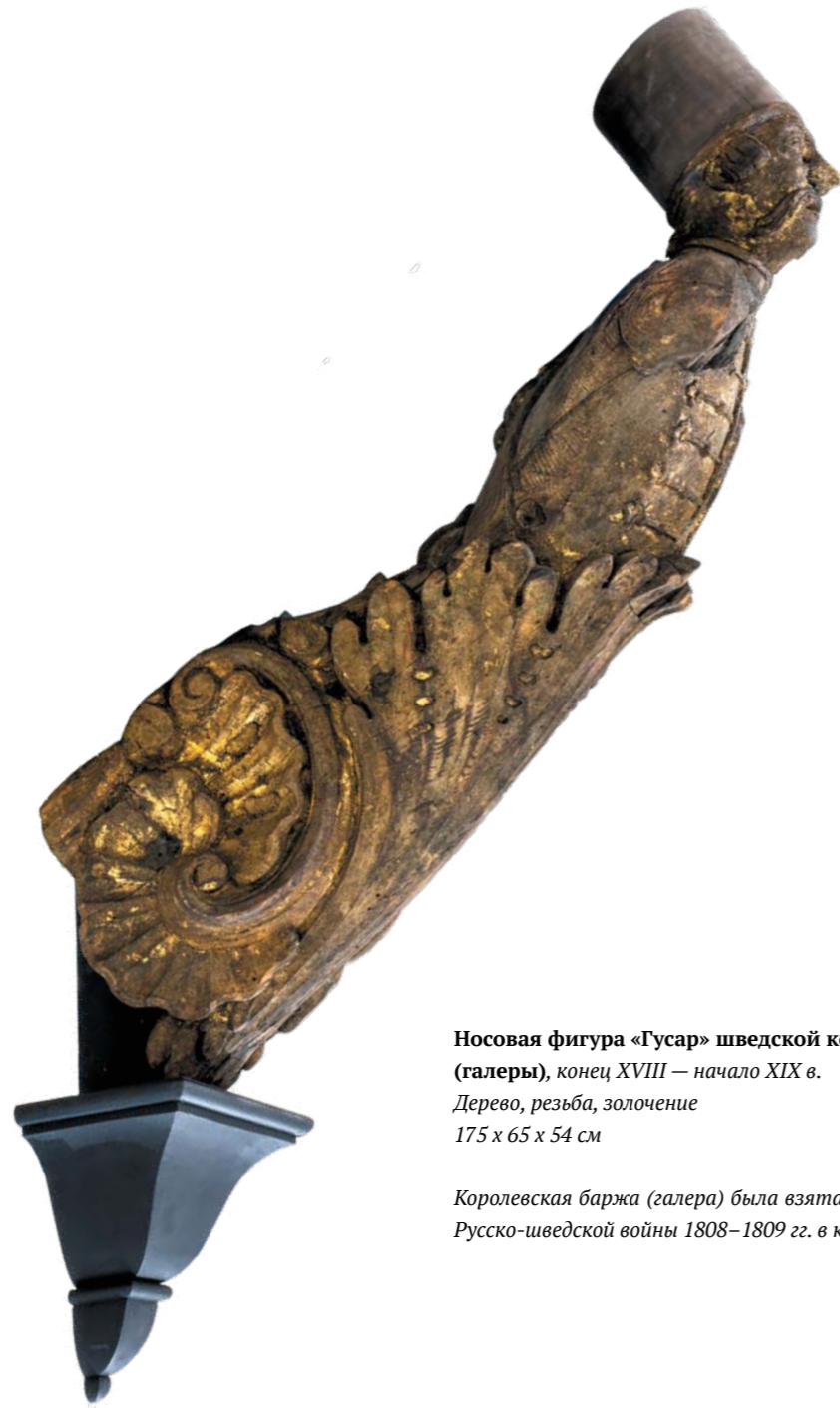
Носовая фигура «Гусар» шведской королевской баржи (галеры), конец XVIII — начало XIX в. Дерево, резьба, золочение 175 x 65 x 54 см

Королевская баржа (галера) была взята в качестве трофея в ходе Русско-шведской войны 1808–1809 гг. в крепости Свеаборг в 1808 г.