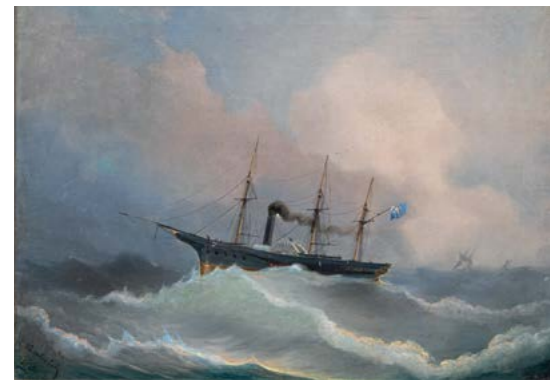
А.П. Боголюбов 14-пушечный пароходофрегат «Камчатка», 1848 г. Холст, масло. 52 x 72 см

Кораблекрушение фрегата «Александр Невский» 25 сентября 1868 г. стало событием, потрясшим императорский дом. Корабль из-за шторма сел на мель и затонул в Северном море у северо-западного побережья полуострова Ютландия. Катастрофа оставила глубокий след в истории русского военного флота и стала символом мужества и стойкости его экипажа. По заказу императора