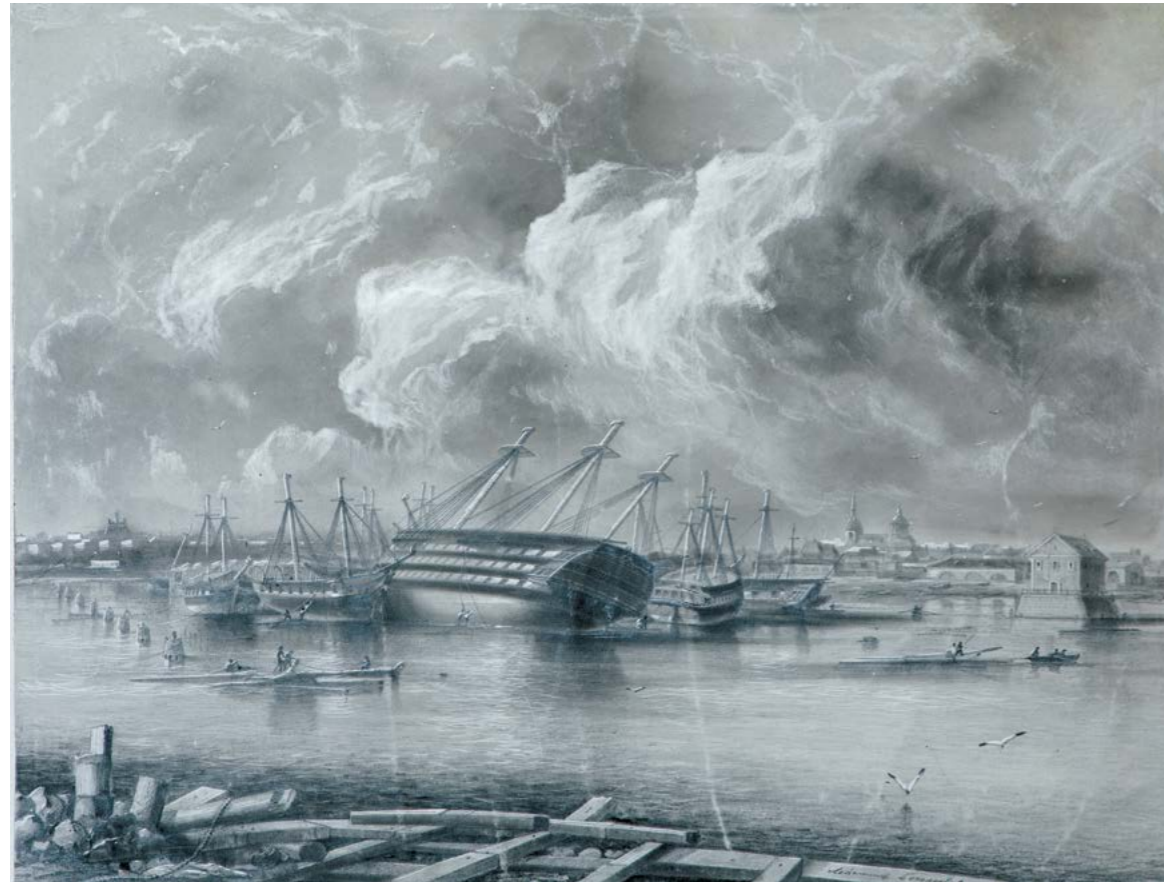
А.П. Боголюбов Кронштадт. Средняя гавань после наводнения 7 ноября 1824 г., вторая половина XIX в. Бумага, гуашь, итальянский карандаш. 30 x 50 см