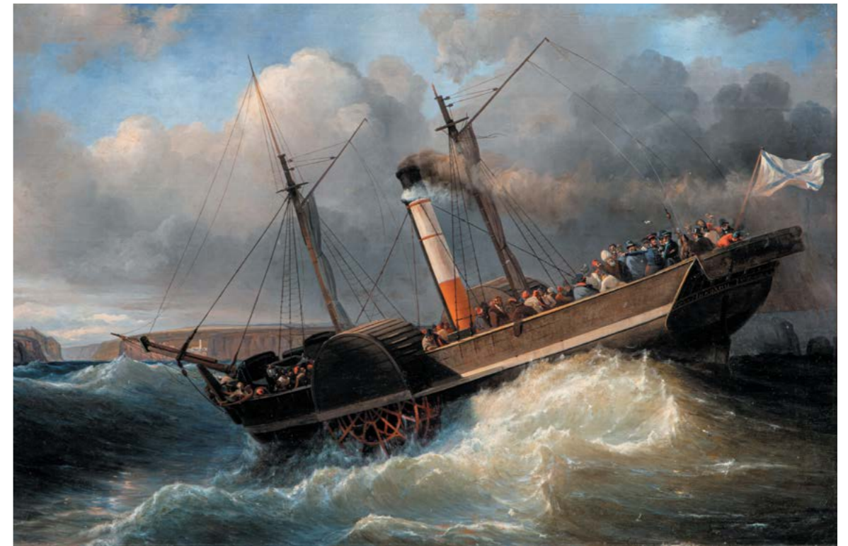
А.П. Боголюбов Пассажирский пароход «Император Николай I» у черноморского побережья, 1840-1850-е гг. Холст, масло. 77,5 x 99 см