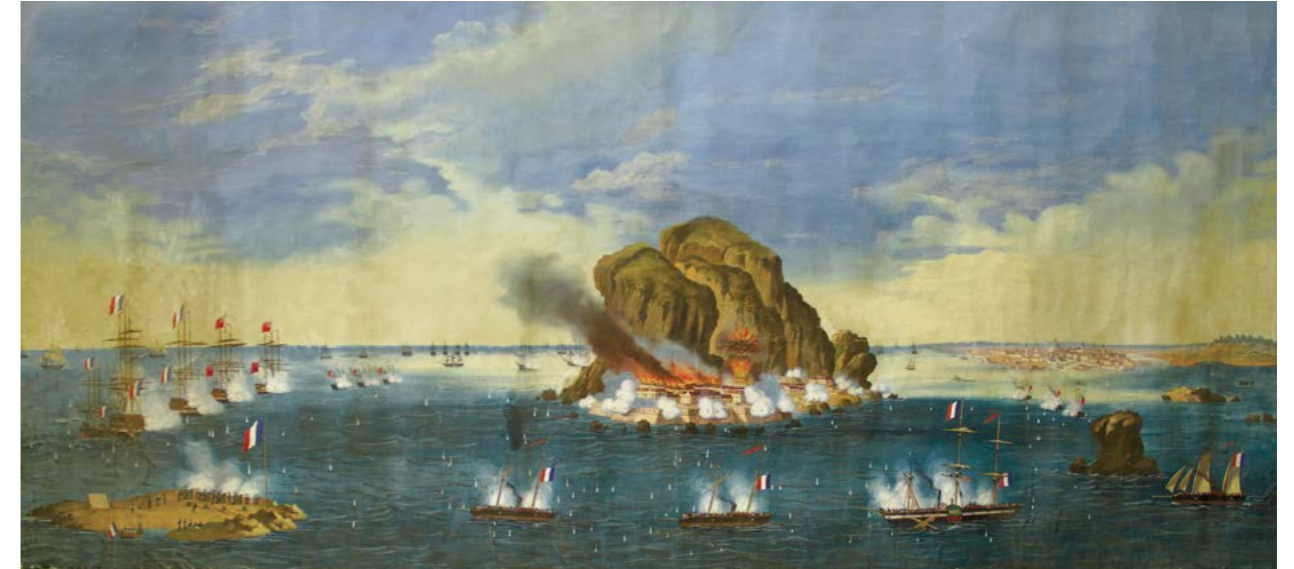
Неизвестный художник Бомбардировка Свеаборга англо-французским флотом 10 августа 1855 г., вторая половина XIX в. Бумага, гуашь. 110 x 245 см

Королевская баржа (галера) была взята в качестве трофея в ходе Русско-шведской войны 1808–1809 гг. в крепости Свеаборг в 1808 г.