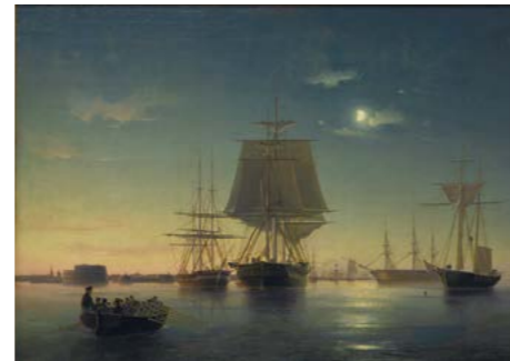
А.П. Боголюбов Кронштадтский рейд, 1855 г. Холст, масло. 61,5 x 86 см

Кадеты изучали двадцать восемь дисциплин, обязательными предметами являлись риторика, фехтование, танцы и изобразительное искусство. Активно неся корабельную службу, А.П. Боголюбов всегда проявлял тягу к изобразительному искусству. Молодой офицер в 1845 г. был зачислен