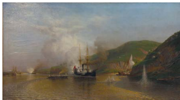
А.П. Боголюбов Атака катером «Шутка» турецкого парохода на Дунае в 1877 г. 1882 г. Холст, масло. 146 x 262 см

В творчестве А.П. Боголюбова отразились наиболее значимые события военной истории, в том числе и современные художнику. В осложнившейся обстановке на Балканах Россия была вынуждена вмешаться в международный конфликт, выступив с рядом предложений для нормализации дел, которые по совету Англии были отвергнуты Турцией. Российский император Александр II в апреле 1877 г. объявил Турции войну. В ходе военной кампании русской армии удалось, используя пассивность турок, провести успешное форсирование Дуная. Работа на местах сражений в ходе Русско-турецкой войны 1877–1878 гг. дала возможность создать наиболее верные изображения. На Дунай А.П. Боголюбов прибыл в июле в 1877 г. и отправился на театр военных действий. «На третий день моего приезда мне дан был паровой катер, на котором наши храбрецы ходили подорывать турок, и мы пошли в приток Дуная, где виднелись мачты затонувших броненосцев». Художник работал вблизи румынского города