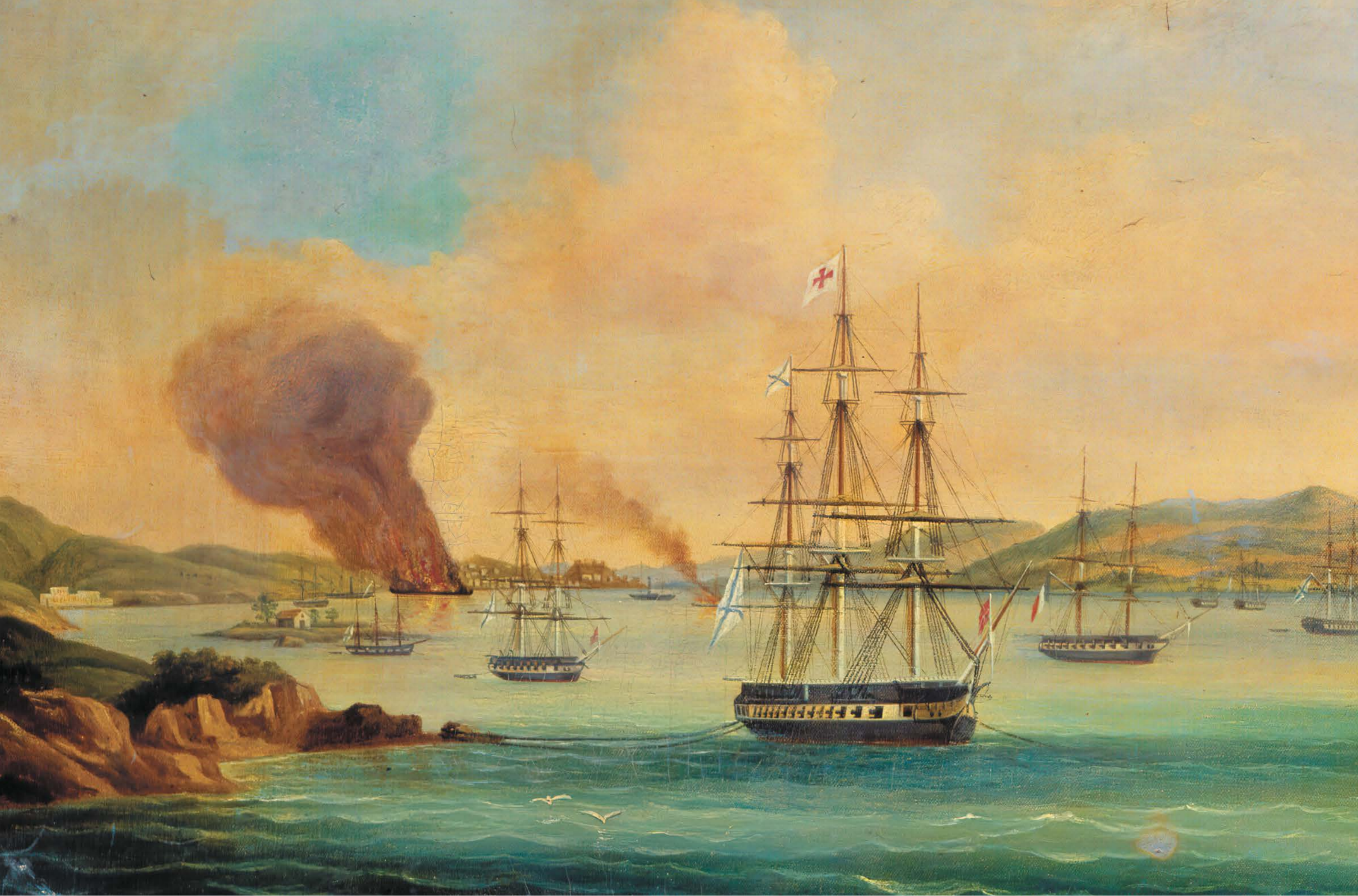
А. П. Боголюбов. Бой люгера «Широкий» с греческим 60-пушечным корветом «Специя» (о. Парос) 27 июля 1831 г. 1841 г.