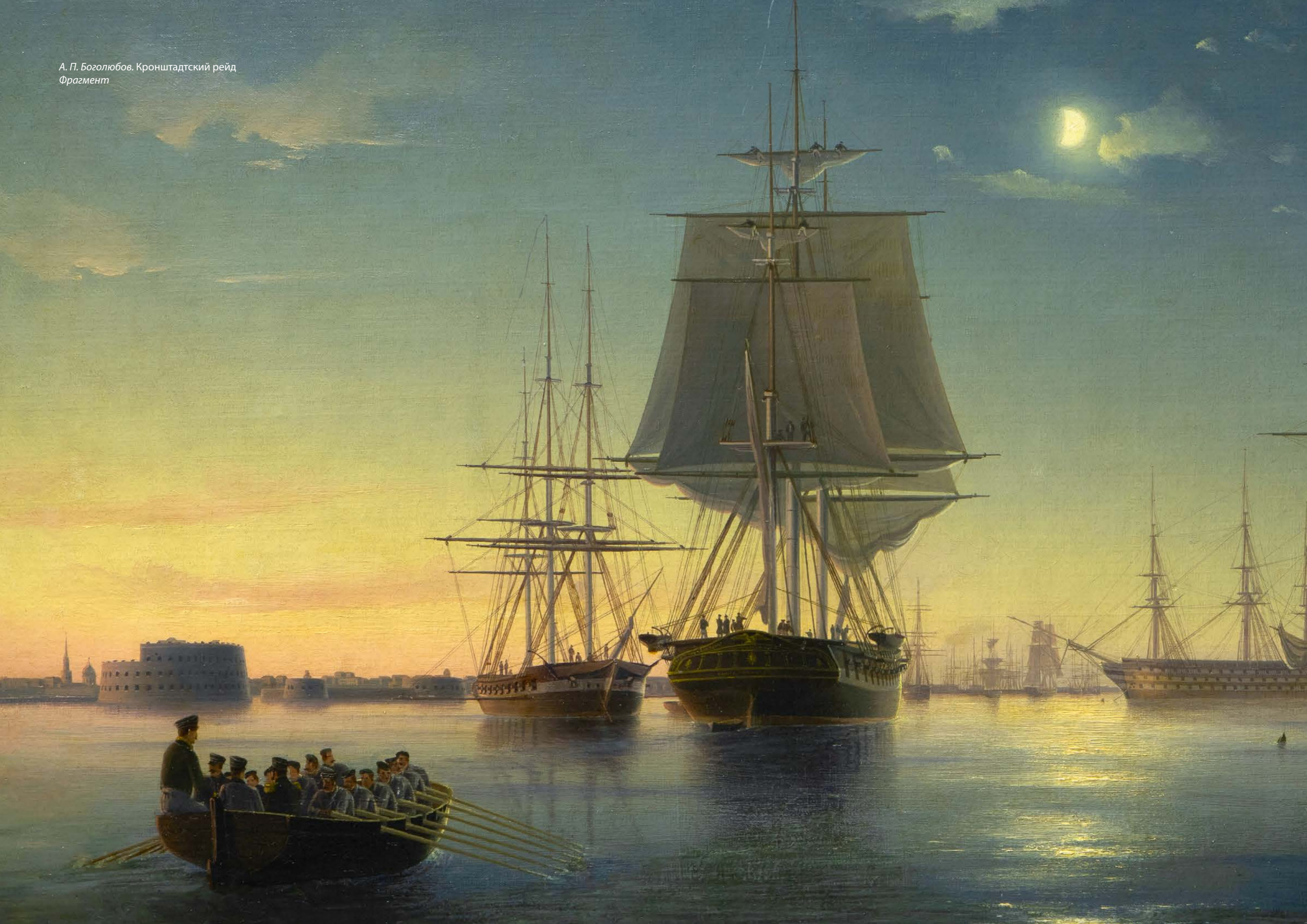
А. П. Боголюбов. Кронштадтский рейд Фрагмент