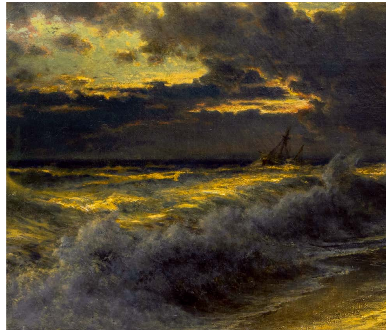
А. П. Боголюбов. Прибой в Ментоне 1880-е гг. Фрагмент

Этот проект дал возможность рассказать широкой аудитории о жизни выдающегося художника А. П. Боголюбова и его творчестве, в котором нашла отражение славная история Военно-Морского Флота России.