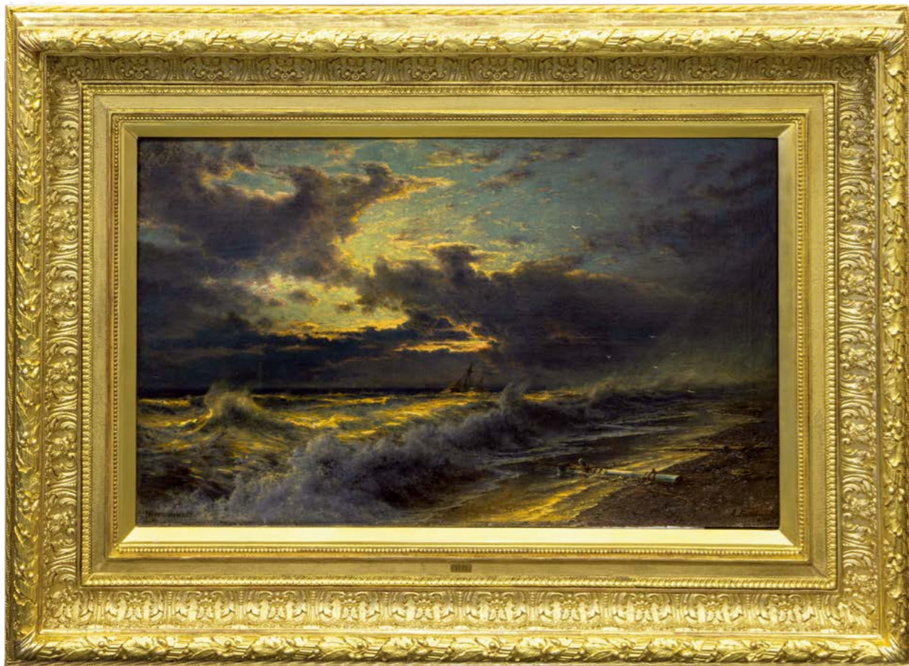
А. П. Боголюбов. Прибой в Ментоне 1880-е гг.

совместной работе с сотрудниками РГАВМФ были проанализированы документы, связанные с хранением картин А. П. Боголюбова в собрание музея в конце XIX — начале XX века, что дало возможность уточнить авторские названия картин.