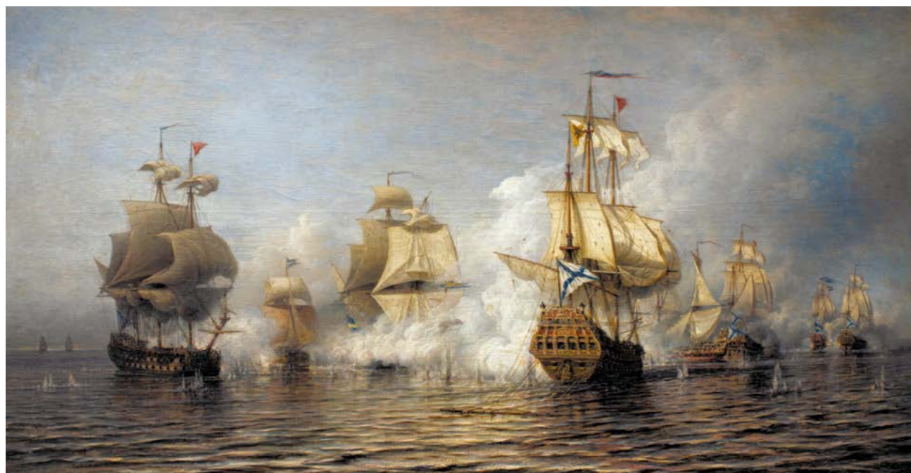
А. П. Боголюбов. Бой у острова Эзель 24 мая 1719 г., 1866 г. Фрагмент

Центральный военно-морской музей имени императора Петра Великого (далее — ЦВММ) хранит славную историю и традиции отечественного Военно-Морского Флота. В год 200-летия со дня рождения художника-мариниста Алексея Петровича Боголюбова (1824–1896) сотрудниками музея создана выставка «Посвящение», которая является одной из весомых частей музейного проекта, направленного на сохранение памяти о выдающемся художнике-маринисте.