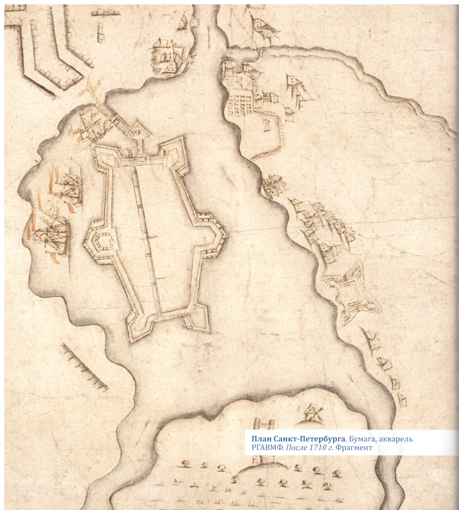
План Санкт-Петербурга. Бумага, акварель РГАВМФ. После 1710 г. Фрагмент