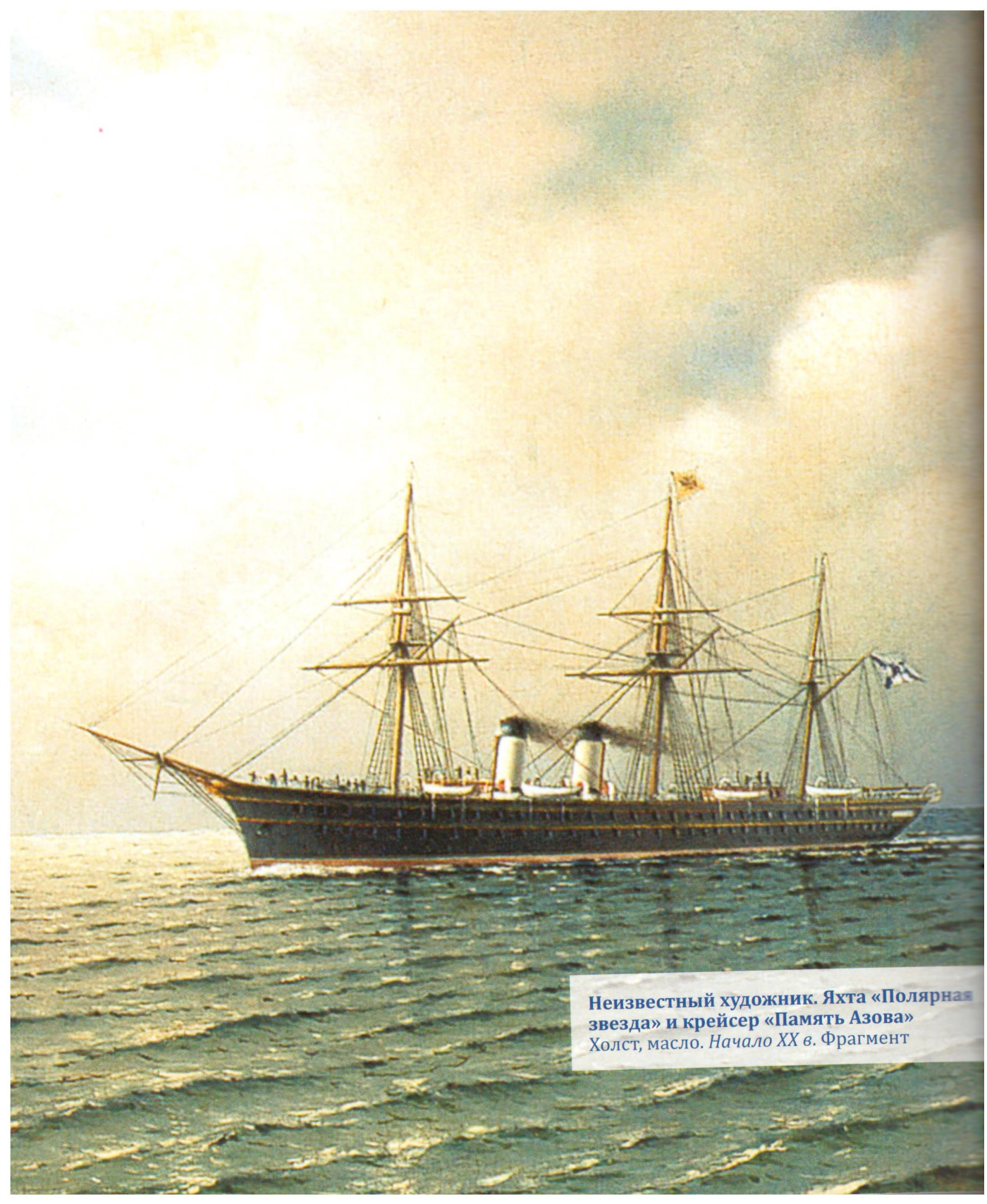
Неизвестный художник. Яхта «Полярная звезда» и крейсер «Память Азова» Холст, масло. Начало XX в. Фрагмент