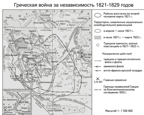
Рис. 1 — Карта «Греческая война за независимость»

и на островах Киклад. Большинство жителей Спесии перебралось на лучше укрепленный остров Гидра (Идра). Правительство обосновалось на о. Эгина. 11 апреля 1827 г. президентом (правителем) Греции был избран граф Иоаннис Антониос Каподистриас (Иван Антонович Каподистрия), который вступил в должность почти через год — 11 января 1828 г.) 1 .