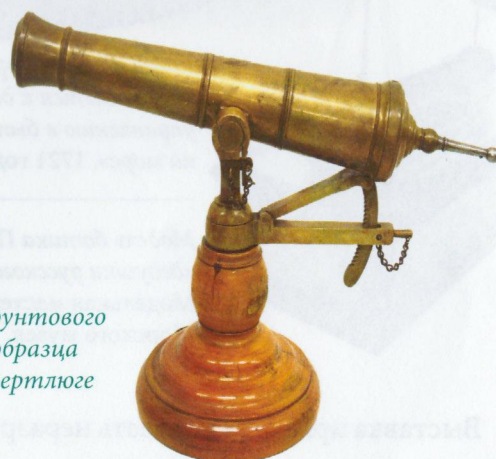
Модель однофунтового фальконета образца 1781 года на вертлюге XIX век

В подготовке выставки участвовали отделы: фондов, информационный, экспозиционный, просветительный, материально-технический, безопасности и режима, научного комплектования и редакционно-издательская группа (с типографией)