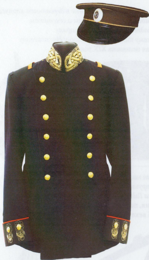
Мундир офицерский инженера-механика русского флота. 1900-е годы

Фуражка офицеров, адмиралов и генералов по флоту образца 1855 года Начало XX века