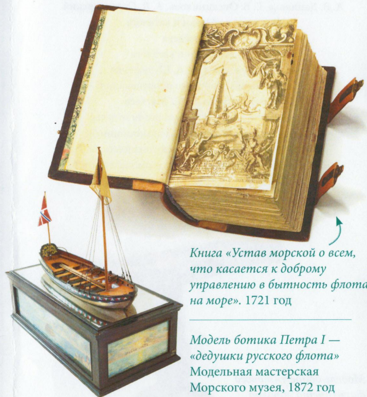
Книга «Устав морской о всем, что касается к доброму управлению в бытность флота на море». 1721 год

Сегодня Военно-Морской Флот России, являясь достойным наследником славных традиций императорского и советского флотов, продолжает выполнять свою историческую миссию по защите национальных интересов и обеспечению безопасности государства.