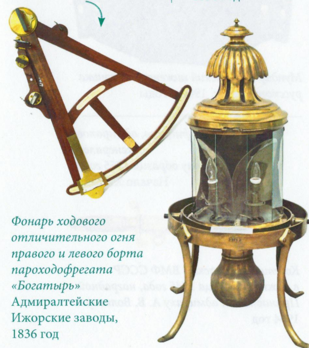
Фонарь ходового отличительного огня правого и левого борта пароходофрегата «Богатырь» Адмиралтейские Ижорские заводы, 1836 год