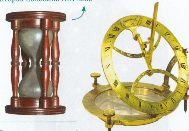
Октан навигационный конструкции Джона Гадлея (Хедли) Англия, первая половина XVIII века

Часы песочные 15-секундные в деревянном корпусе для работы с ручным лагом и секстаном. Принадлежали генерал-адмиралу великому князю Константину Николаевичу Вторая половина XIX века